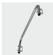
Opcjonalna rampa (odnośnik: 02376450)