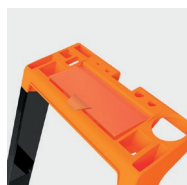
Uchwyt na narzędzia z wbudowanym zamknięciem