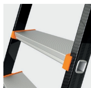
Stopnie z ekstrudowanego aluminium o szerokości 110 mm, antypoślizgowe