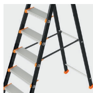
Paski do modeli 7/8-stopniowych