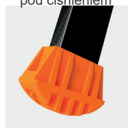
Podkładki na stopach o wysokim stopniu bezpieczeństwa