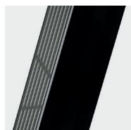
Malowane epoksydowo pionowe słupki